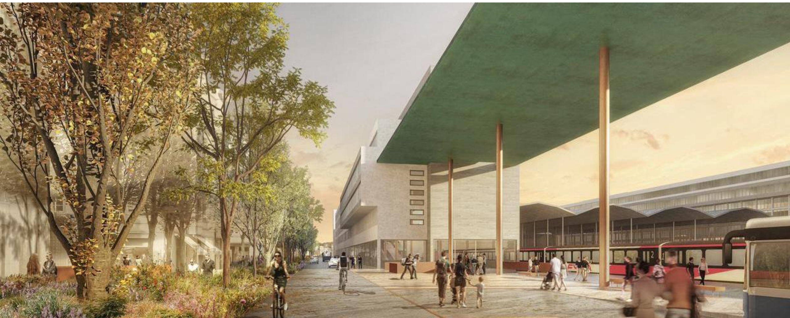
Nouvelle place de la gare à la Zentralstrasse à Lucerne, visualisation de 2021 (équipe Güller Güller, Atelier Brunecky, Zurich)